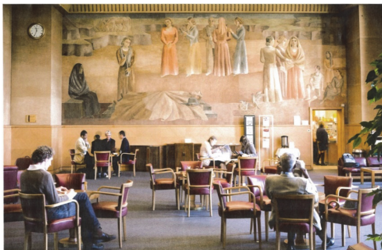
Le Salon suisse. Transformé en bar dans les années 60, il est décoré de fresques de peintres suisses évoquant des scènes de l'histoire nationale.

LE PALAIS DES NATIONS, VÉRITABLE CITÉ AU COEUR DE LA GENÈVE INTERNATIONALE, A ENTREPRIS DEPUIS 2012 UNE IMPORTANTE RÉNOVATION, EN COMMENÇANT PAR SES FENÊTRES, VÉRITABLES PASSOIRES THERMIQUES. DE GRANDS TRAVAUX SE DÉROULERONT DE 2015 À 2023.